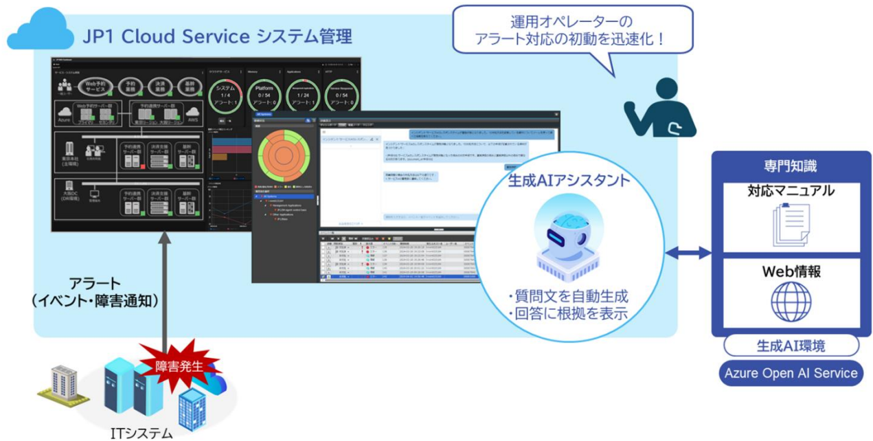
JP1 Cloud Service の生成 AI を活用したアラート対応の概要

株式会社日立製作所(以下、日立)は、統合システム運用管理「JP1」の SaaS 版である「JP1 Cloud Service」のシステム管理において、生成 AI を活用して運用オペレーターによるアラート対応の初動を迅速化できる生成 AI アシスタントを追加し、4月26日から販売開始します。これにより、システムから発生したアラート(イベント・障害通知など)に対して、運用オペレーターが適切な対処方法を判断する初動時間を短縮することができます。なお、先行して実施した社内の実証実験 *1 において、アラート対処方法に関する生成 AI の回答内容の正当性を評価し、9割以上 *2 のアラートで正しい対処方法を回答していることを確認しました。加えて、生成 AI の回答に、対処方法だけでなく根拠となるマニュアルなどの引用元の表示も追加することで、運用オペレーターの判断を支援できました。これらにより、日立グループの運用監視業務において、初動の判断時間を約 2/3 に短縮 *1 できる効果を確認しました。